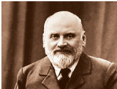
М. А. Балакирев

Всякое празднование юбилейных дат композиторов начинается с фраз о популярности их произведений, включении их в репертуар известных исполнителей, а в нашем случае, то есть ДМШ и ДШИ, об интересе к ним со стороны юных слушателей. Все так, но не с русским композитором Милием Алексеевичем Балакиревым.