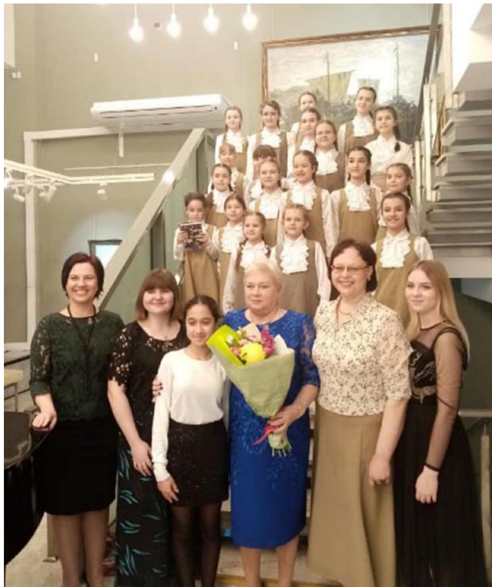
Мы – балакиревцы!

Русь, Родина, Россия... Я, пожалуй, не припомню музыканта, композитора, который столь же трепетно и с такой горячностью произносил эти слова, потому что для Балакирева они были словами его сердца, его души. Не случайно этот человек, отдающий свой талант, творческую энергию, всего себя делу служения музыкальной культуре России, стал примером для подражания и путеводной звездой для юных музыкантов нашей Родины. Так в современной России появились детские музыкальные школы и детские школы искусств имени Милия Алексеевича Балакирева.