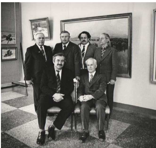
Группа художников студии им. Грекова. Авторы панорамы «Сталинградская битва» в ВМИИ на выставке своих работ. 1982 г.

Листая подлинные документы из архивных фондов Центра документации новейшей истории Волгоградской области за 1980-е годы, отражающие историю строительства музея-панорамы «Сталинградская битва», сразу отмечается большой и ощутимый вклад в создание мемориального комплекса большого количества комсо-