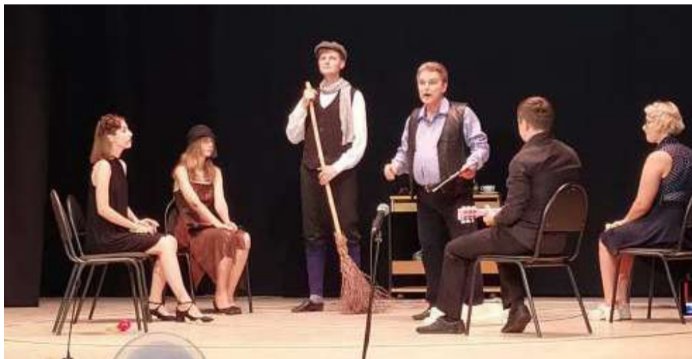
Выступление инклюзивного театра «Пламя»