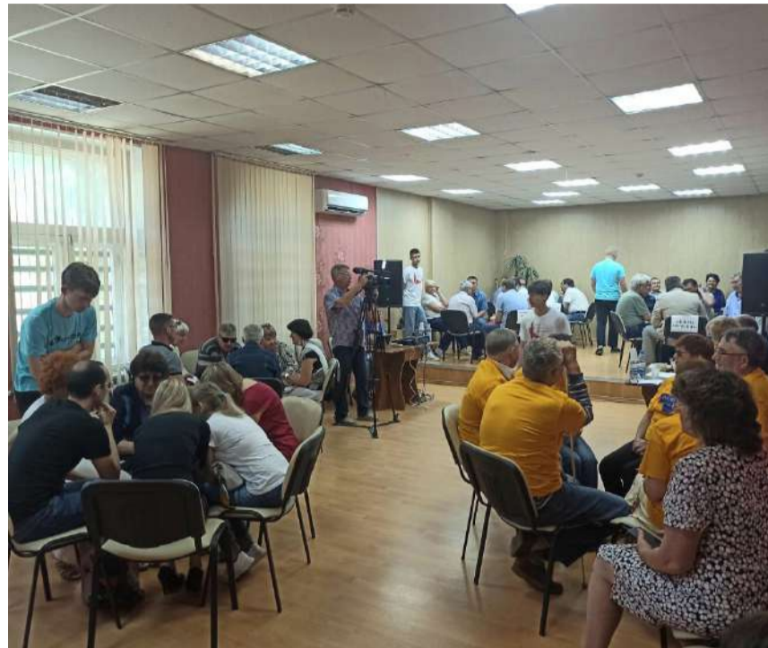
Игра «Что? Где? Когда?»