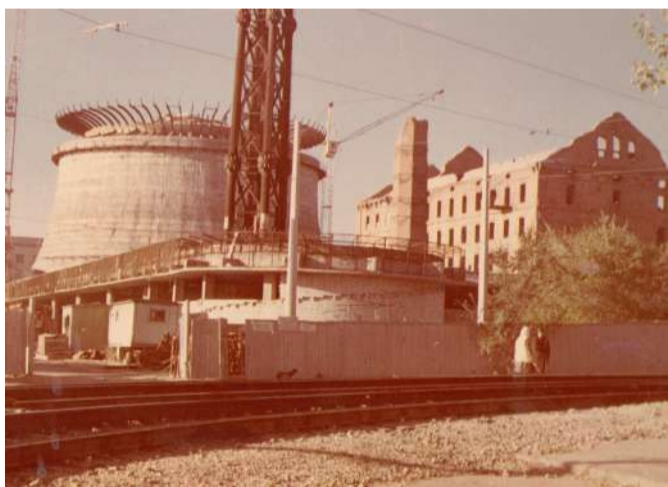
Строительство музея-панорамы «Сталинградская битва». 1980 г.