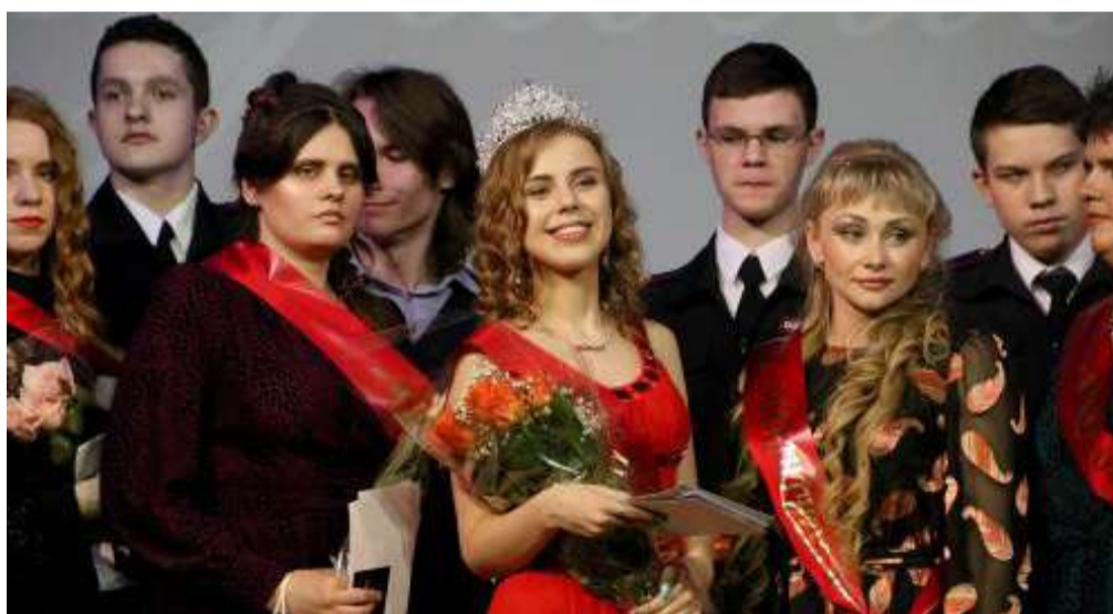
Конкурс красоты – 2020