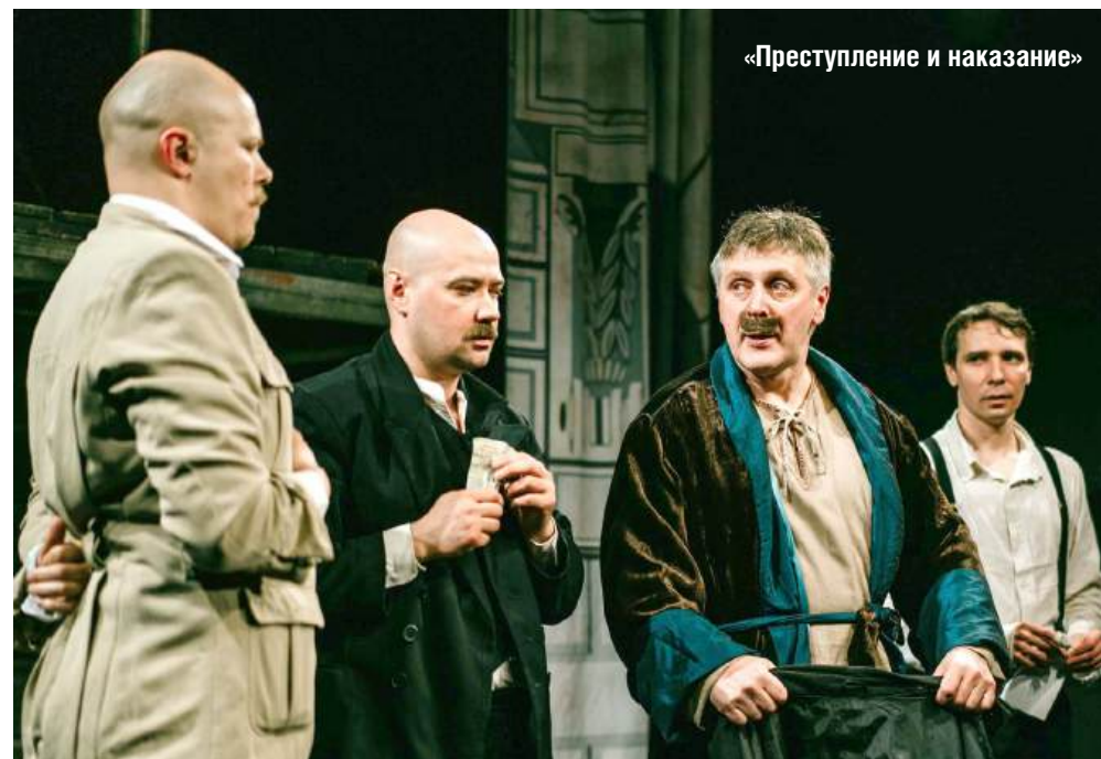
«Преступление и наказание»