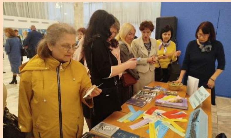
И серебряный месяц ярко Над серебряным веком стыл...