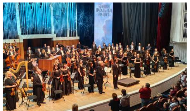
Фото театра «Царицынская опера»

Без этой базы трудно всерьез говорить об опере как жанре: барокко трансформировалось, менялось, но в нем заложены незыблемые принципы самой оперной речи. Название концерта выбрано не случайно: любое искусство изначально зарождалось как религиозное служение и несло духовную первопричину, а мы продолжаем эту традицию, возвращаясь к истокам.